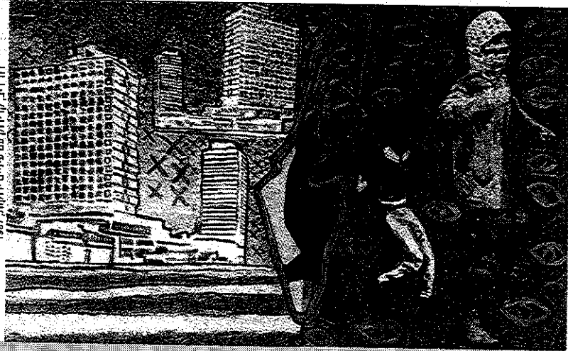
דוד רובין, קיבוץ עין חרוד, 1987