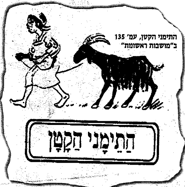
התימני הקטן, עמ' 135 ב'מושבות ראשונות'