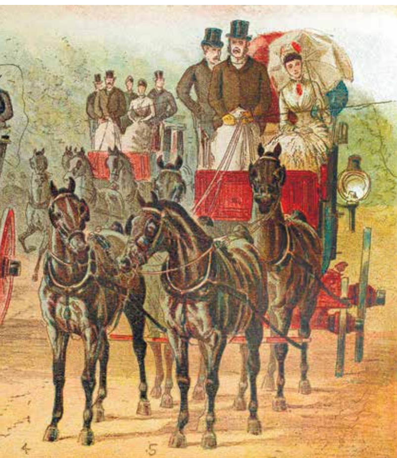
כרכות סוסים בלונדון בסוף המאה ה-19. מפעל חייה של הימלפרב הוקדש לניפוץ

למרבה הצער, עורכי הקובץ המונח לפנינו תירגמו רק טעמים מן העבודה הוויקטוריאנית של הימלפרב ("שאלת היהודים", "היהודי כוויקטוריאני", "אבירי התרבות" ו"בנג'מין דיז'וראלי"). רור בו מוקדש למסות הפולמיות, שחלקן נכתבו לפני עשרות שנים. שליש מן המסות בקובץ מוקדשות לפולמוסים פילוסופיים (למ"ש של "ממרקס להגל" ו"צומת הדמים בין דת ללאומיות"), שבע-טיים נאמר כי הימלפרב דוחפת את אפה באובססיות לתחומים שבהם אינה מתמצאת כדי לקדם פוליטיקה מוסרנית. שליש נוסף מוקדש לפולמוס החבוט עם ההיסטוריונים החדשים ("ההיסטוריה החדשה חדשה", "ההיסטוריה החדשה ישנה", "האם ההיסטוריה אומרת דברי טעם?" "קץ ההיסטוריה" ו"קדמונים מול מודרניים"). הימלפרב בזה להיסטוריה חדשה שמקדמת לטענתה רליטיביזם