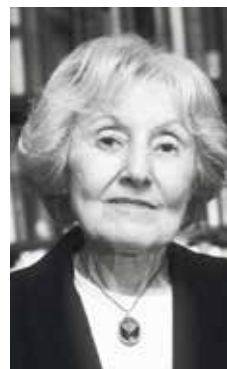
גרטרוד הימלפרב

גרטרוד הימלפרב היא היסטוריונית מוערכת, שמחקרה על החברה הוויקטוריאנית מהדהדים את השיח על הדתה, והפיכתה מקומוניסטית אדוקה למבשרת הניאור-שמרנות