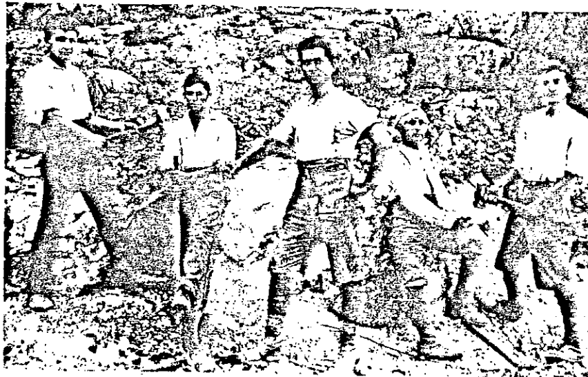
פועלים בעבודת סלילה כחיפה בשנות העשרים